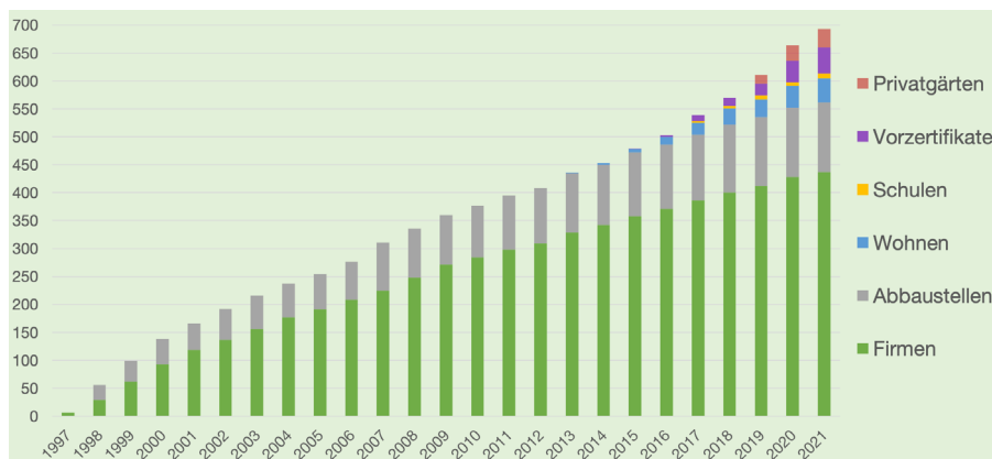
Die Stiftung Natur & Wirtschaft zeichnete seit 1997 mehr als 600 Areale aus. 24 Prozent davon und somit der Grossteil dieser Areale sind Firmen aus dem Dienstleistungssektor. Es folgen mit 21 Prozent Kiesabbaubetriebe und mit 19 Prozent Industriebetriebe.